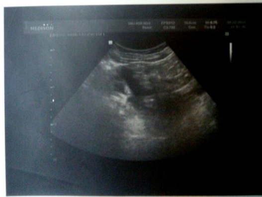
شکل ۲- نمای سونوگرافی بیمار قبل از درمان